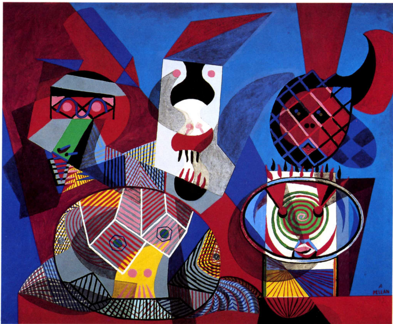
A L F R E D P E L L A N , M a s c a r a d e , 1 9 4 2