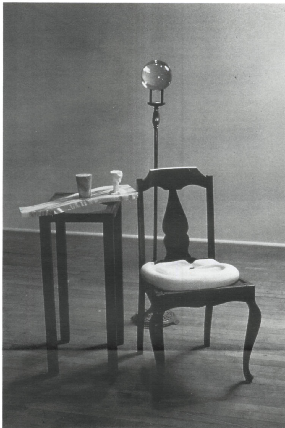
Le Ruisseau en profondeur , 1985 Bois, métal, savon, verre, plâtre et mousse 135 x 90 x 100 cm

Avec ces œuvres singulières, au premier abord énigmatiques, voire impénétrables pour certains — si ce n'est au travers de l'irrésistible séduction qu'exercent parfois quelques composantes qui nous retiennent, une transparence, un matériau, la forme rare d'un objet —, Mihalcean fait figure de Petit Poucet. Chacun des éléments de la sculpture, ainsi chargé de son sens propre, de son pouvoir d'évocation, de sa dimension poétique souvent insoupçonnée, joue comme un repère, nous entraînant de façon surprenante dans un monde riche de réminiscences et d'émotions.