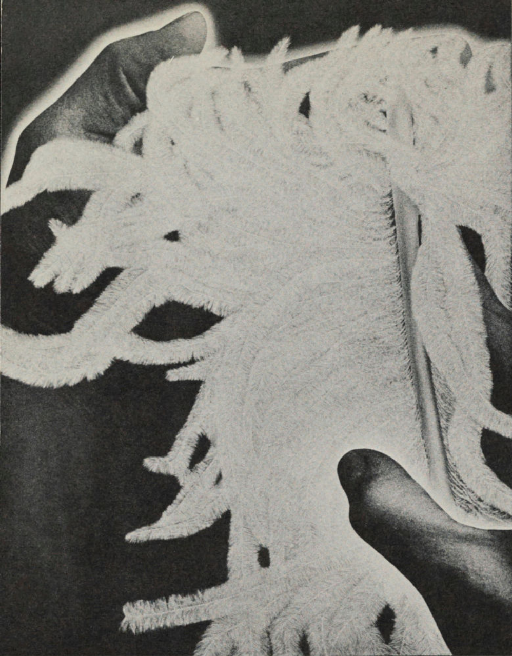
5- La plume Huile sur lin avec émulsion 62" x 48"