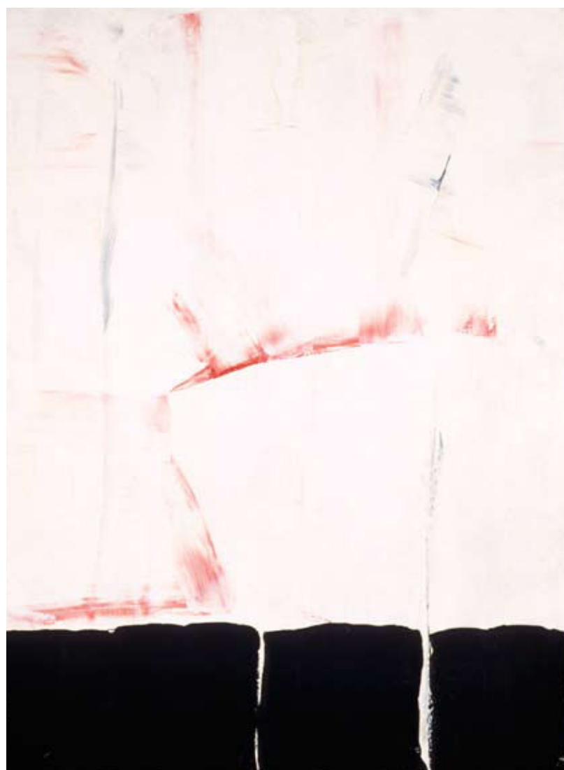
PAUL-ÉMILE BORDUAS, SANS TITRE (N° 39), 1958. HUILE SUR TOILE. DON DES MUSÉES NATIONAUX DU CANADA. COLLECTION MUSÉE D'ART CONTEMPORAIN DE MONTRÉAL. © SUCCESSION PAUL-ÉMILE-BORDUAS/SODRAC (2010)