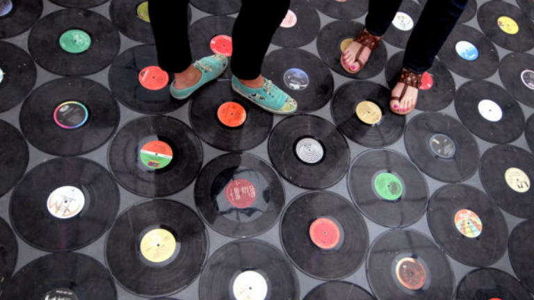
Vue de l'installation de Christian Marclay, Untitled , 2007 pour l'exposition Sympathy for the Devil: Art and Rock and Roll Since 1967 .

L'exposition porte sur les liens qui se sont tissés entre l'art contemporain et la musique rock au cours des quarante dernières années. Elle réunit plus de 130 œuvres, réalisées par une soixantaine d'artistes et collectifs, regroupées en six parties correspondant aux scènes musicales de New York, du Royaume-Uni, de l'Europe continentale, de la côte Ouest nord-américaine, du Midwest américain et du reste du monde.