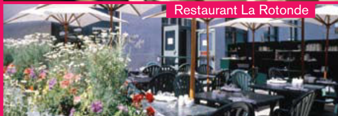
Restaurant La Rotonde