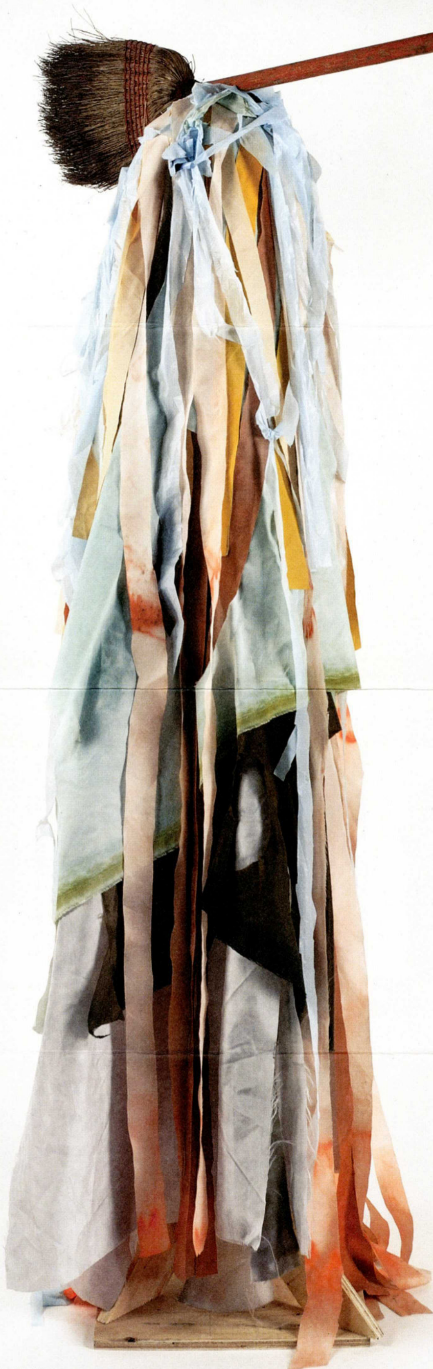
Geoffrey Farmer, I am by nature one and also many, dividing the single me into many, and even opposing them as great and small, light and dark, and in ten thousand other ways , 2001.