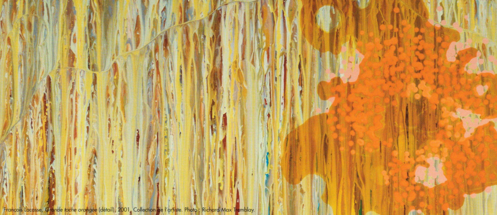
François Lacasse, Grande tache orangée (détail), 2001, Collection de l'artiste.