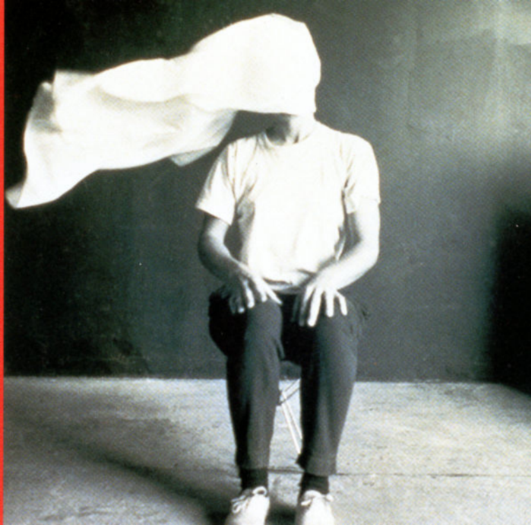
Photo: Robert Aronoff / F. H. 1996. Publié en 1991 par la Sean Kelly Gallery, New York. Avec l'amable permission de l'artiste.