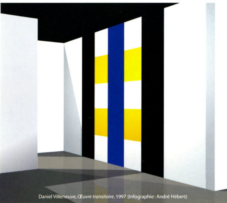
Daniel Villeneuve, Œuvre transitoire , 1997 (Infographie : André Hébert)

Le Musée d'art contemporain de Montréal est une société d'État subventionnée par le ministère de la Culture et des Communications du Québec et bénéficie de la participation financière du ministère du Patrimoine canadien et du Conseil des Arts du Canada.