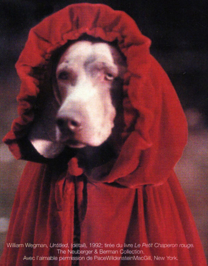
William Wegman, Untitled , (détail), 1992; tirée du livre Le Petit Chaperon rouge . The Neuberger & Berman Collection.

Le Musée d'art contemporain de Montréal est une société d'État subventionnée par le ministère de la Culture et des Communications du Québec et bénéficie de la participation financière du ministère du Patrimoine canadien et du Conseil des Arts du Canada.