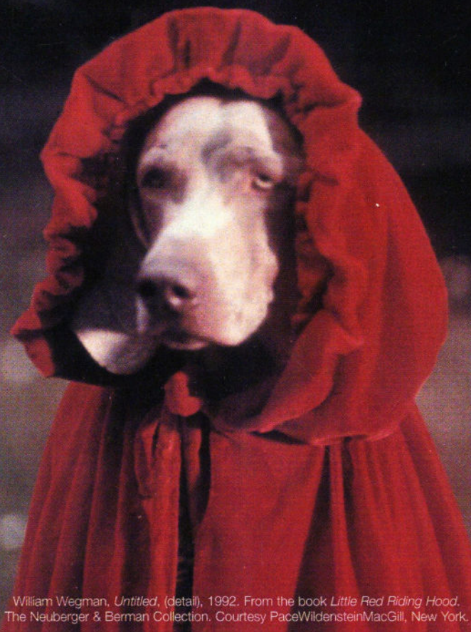
William Wegman, Untitled , (detail), 1992. From the book Little Red Riding Hood . The Neuberger & Berman Collection.

The Musée d'art contemporain de Montréal is a provincially owned corporation funded by the ministère de la Culture et des Communications du Québec. The Musée receives additional financial support from Canadian Heritage and the Canada Council.