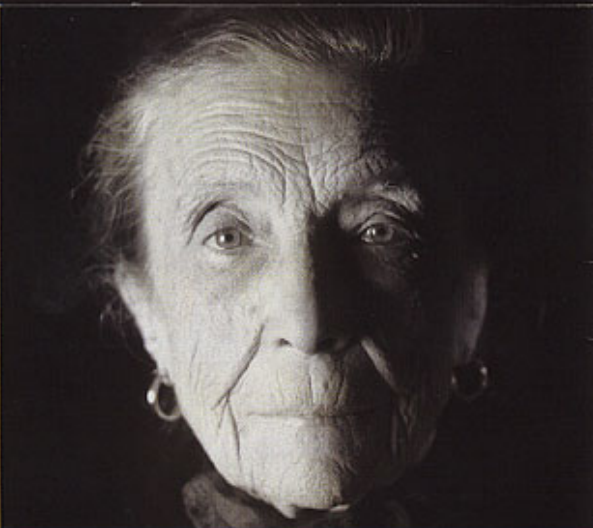
photo: photography of Louise Bourgeois.